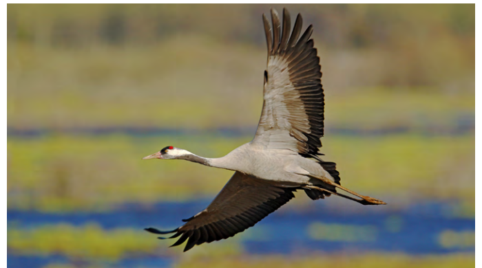
En route vers le sud ! Les grues et autres oiseaux migrateurs s'envolent là où ils trouvent suffisamment de nourriture.

Avant l'hiver, de nombreux oiseaux partent vers le sud, où il fait plus chaud. Les hirondelles, les cigognes et les grues en font partie. Ils volent souvent en grands groupes et forment ainsi une « formation en V ». Celle-ci permet de réduire la résistance au vent et d'économiser des forces. Le voyage est très fatigant, mais dans les pays chauds, les oiseaux trouvent suffisamment à manger pour reprendre des forces.