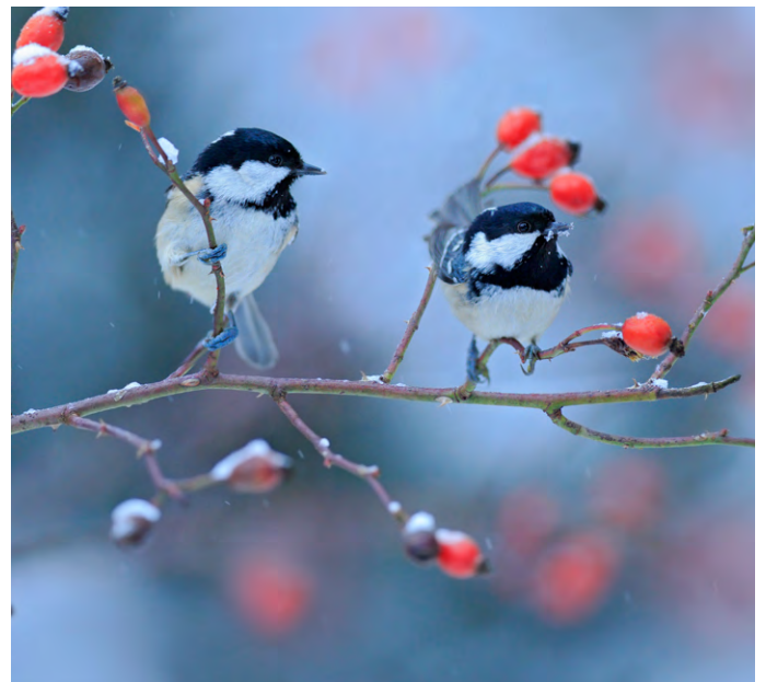
Les mésanges sont des hôtes appréciés dans nos jardins en hiver.

Certains oiseaux, comme les merles, les mésanges ou les rouges-gorges, restent ici. Ils ont un épais plumage qui leur tient chaud. Ils cherchent des graines et des grains pour survivre. .