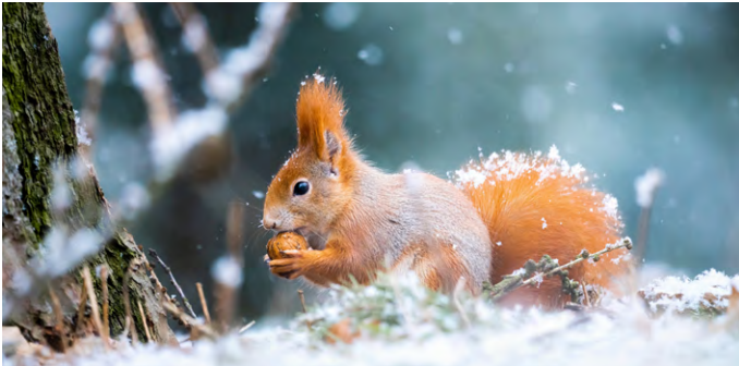
Même en hiver, l'écureuil cherche assidûment sa nourriture.

D'autres animaux, comme les blaireaux, les castors ou les écureuils, ne font pas de pause aussi longue. Ils hivernent. Cela signifie qu'ils sont moins actifs, qu'ils se reposent souvent, mais qu'ils se réveillent régulièrement. Souvent, ils ont accumulé auparavant des réserves de nourriture qu'ils mangent ensuite. Une fourrure épaisse les tient au chaud. Les castors ont même une fourrure imperméable.