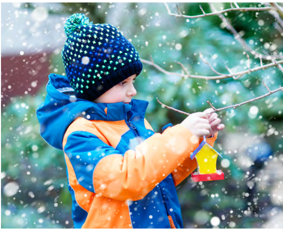
Avec la bonne nourriture, tu peux aider les oiseaux qui hibernent ici.

La plupart du temps, les animaux se débrouillent seuls en hiver. Mais les oiseaux apprécient un peu d'aide lorsque le sol est gelé ou qu'il y a de la neige. Tu peux leur offrir des graines ou des boules de graisse. Veille à ce que la nourriture reste sèche et ne moisisse pas. Tu ne devrais pas donner de pain, car cela rend les oiseaux malades.