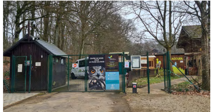
À Dudelange, on s'occupe avec amour des animaux blessés dans la station de soins.

Certains animaux dorment tout l'hiver. Ils hibernent. C'est le cas par exemple des hérissons, des chauves-souris et des loirs. Avant de dormir, ils mangent beaucoup en automne et se constituent un épais coussin de graisse. Cela leur donne de l'énergie en hiver. Dans leur lieu de sommeil, ils abaissent leur température corporelle et respirent plus lentement. Ils économisent ainsi leurs forces et traversent bien la saison froide.