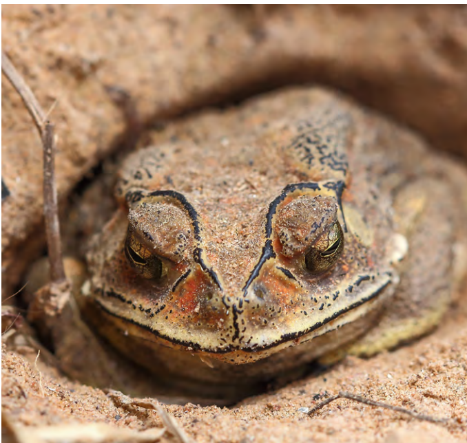
Les grenouilles et autres amphibiens s'enfoncent dans la boue pour survivre à la saison froide.

Les insectes et les grenouilles font autre chose : ils se figent en hiver. Leur corps devient aussi froid que l'environnement. Ils ont alors parfois l'air d'être morts. Beaucoup se cachent dans la terre ou sous les feuilles, là où il fait plus chaud. Certains ont même de l'antigel dans le sang pour ne pas geler. Quand il fait à nouveau plus chaud, ils se réveillent et se déplacent normalement.