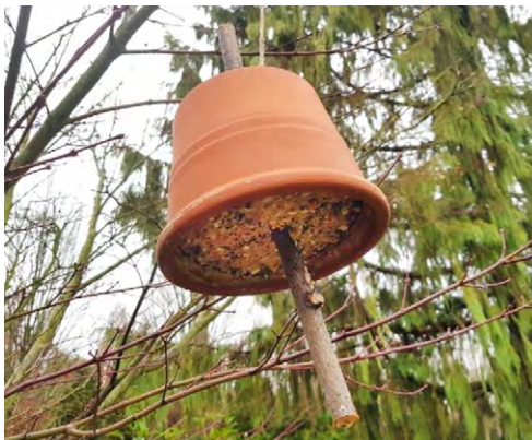
Voici à quoi ressemble la cloche à nourriture.