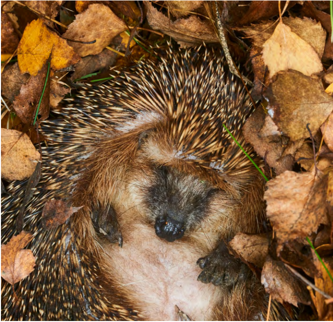
En hiver, les hérissons se blottissent confortablement dans des tas de feuilles mortes.