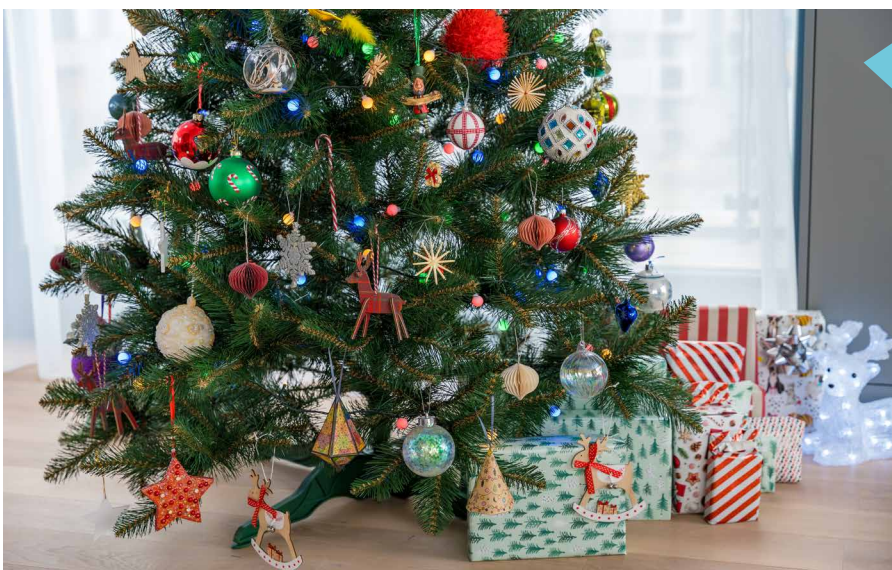
Les arbres en plastique ne sentent rien.

Plastique pratique ou parfum romantique de sapin ? Qu'est-ce que tu préfères ?