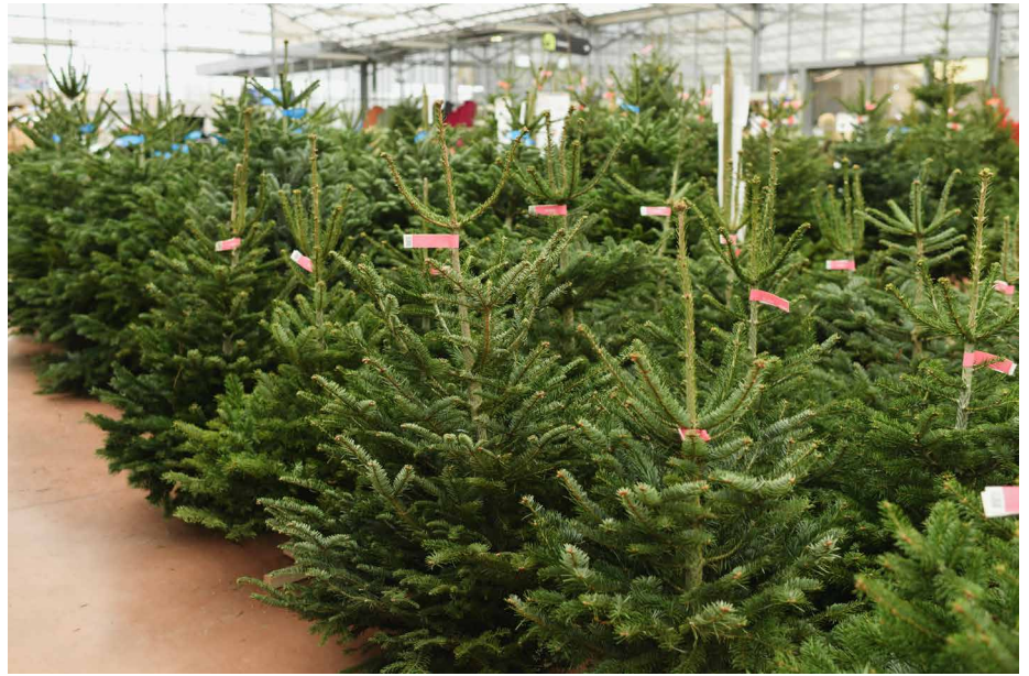
On peut acheter des sapins de Noël, par exemple, dans les magasins de bricolage.

Mais aller dans la forêt et couper soi-même un arbre n'est pas possible ! C'est même interdit ! La forêt et les arbres appartiennent à quelqu'un. Prendre simplement un arbre dans la forêt constitue un vol.