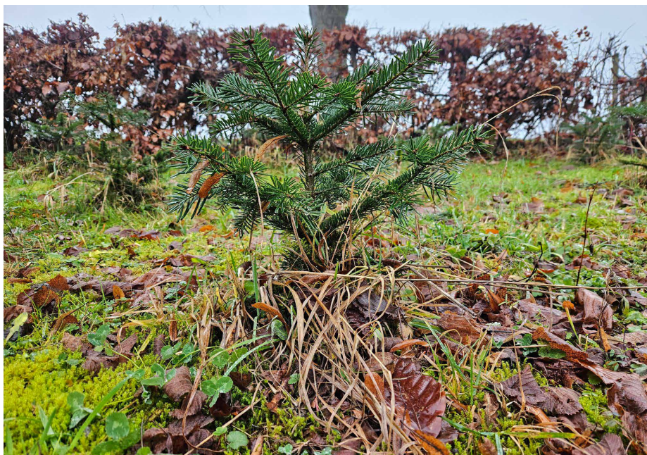
Lorsque les arbres sont plantés, ils sont encore très petits.