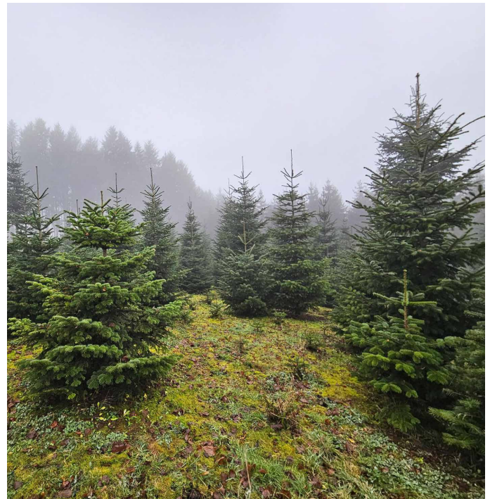
Sur cette plantation, dans le nord du Luxembourg, poussent des sapins de Nordmann.

Pour Noël, différents arbres sont décorés : des épicéas (comme l'épicéa bleu ou l'épicéa commun), des sapins (comme les sapins bleus ou les sapins de Nordmann), des pins et d'autres espèces. Ils poussent soit dans la nature, dans la forêt, soit parfois même dans ton jardin. Il existe aussi des champs spécialement aménagés où de nombreux arbres sont plantés très près les uns des autres. Ces champs s'appellent des plantations. Les arbres poussent entre huit et quinze ans avant d'être coupés. À ce moment-là, ils ont une bonne taille pour les salons ordinaires. Les arbres plus grands ont besoin de plus de temps.