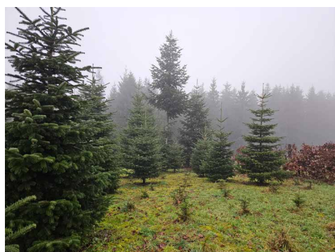
Sur ces grands sapins, les corbeaux peuvent se reposer à leur guise.

Lorsque les foyers, les marchés de Noël et les magasins veulent chacun leur propre sapin, il faut bien sûr beaucoup d'arbres. Mais ils ne poussent pas tous dans la forêt. Il existe des plantations où des arbres sont cultivés spécialement pour Noël. Les tout petits arbres viennent de la pépinière. Là, ils poussent à partir de graines pendant environ trois ans. Après cela, ils sont assez grands pour être plantés dans la plantation. Comme chaque année des arbres sont coupés pour être vendus, il faut toujours en replanter de nouveaux.